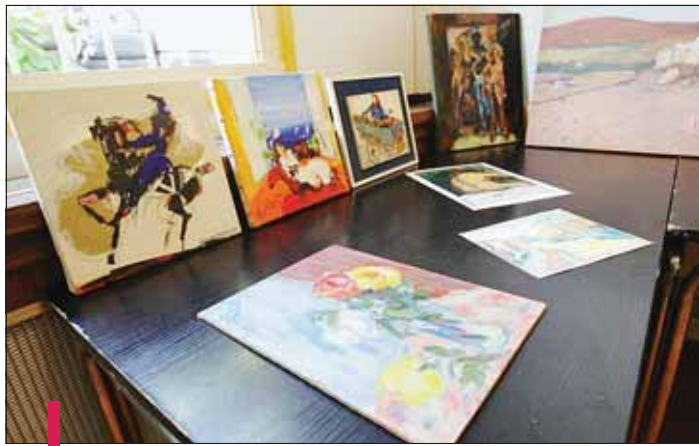
Les tableaux - dont un Picasso - d'une valeur globale de 533 000 € ont été retrouvés dans l'appartement d'un particulier.

Là où les choses se compliquent, c'est que 27 de ces tableaux - dont un Picasso - dont la valeur globale est estimée à près de 533 000 €, proviennent du vol de 31 tableaux dans une résidence privée de La Cadière d'Azur, dans la nuit du 30 au 31